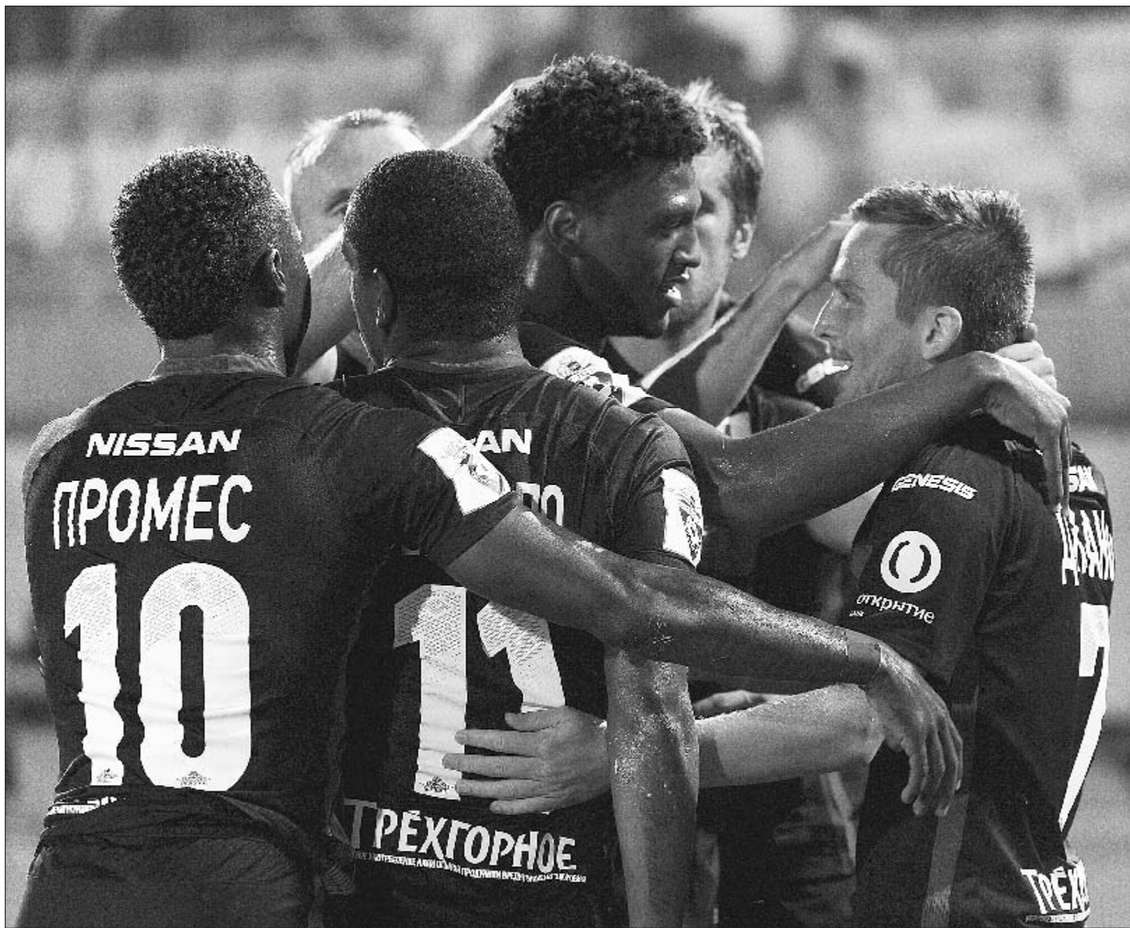
Вчера. Каспийск. «Анжи» - «Спартак» - 0:2. Игроки красно-белых празднуют очередную победу в чемпионате.

Вчера «Спартак» победил в гостях «Анжи» и ушел на двухнедельную паузу в чемпионате России в роли лидера. При Массимо Каррере, возглавившего красно-белых после отставки Дмитрия Аленичева, набрано 10 очков из 12 возможных.