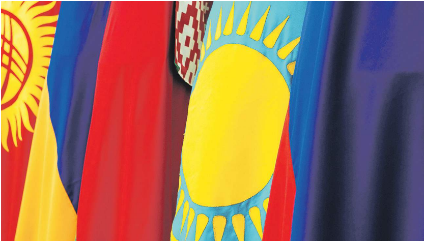
Создание валюты для ЕАЭС нужно в том числе для снижения риска санкций

Предполагается, что единая валюта стран ЕАЭС (Россия, Белоруссия,