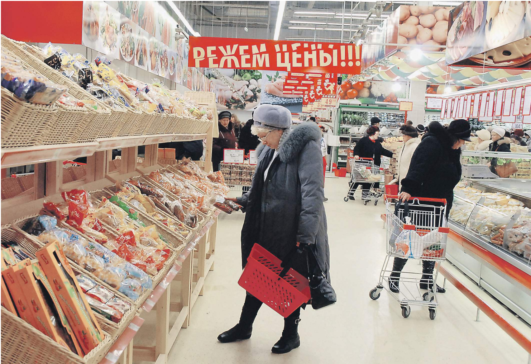
Торговые сети хотят удержать цены в магазинах на фоне роста НДС