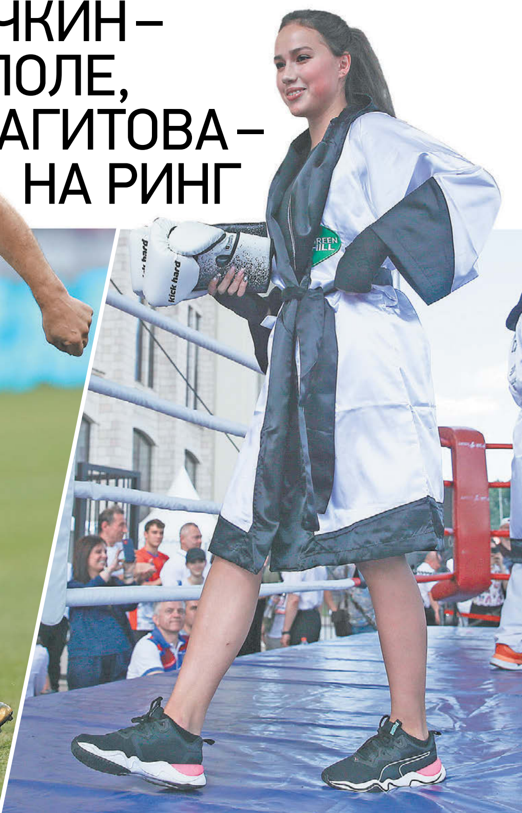
Суббота. Москва. Лужники. Алина Загитова на боксерском ринге

❖ Сыграю ли я еще за «Динамо»? Не знаю, это будет решать руководство. Хотелось бы мне? Конечно! ❖