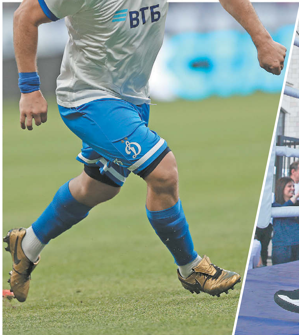
Суббота. Москва. Петровский парк. Александр Овечкин на футбольном поле