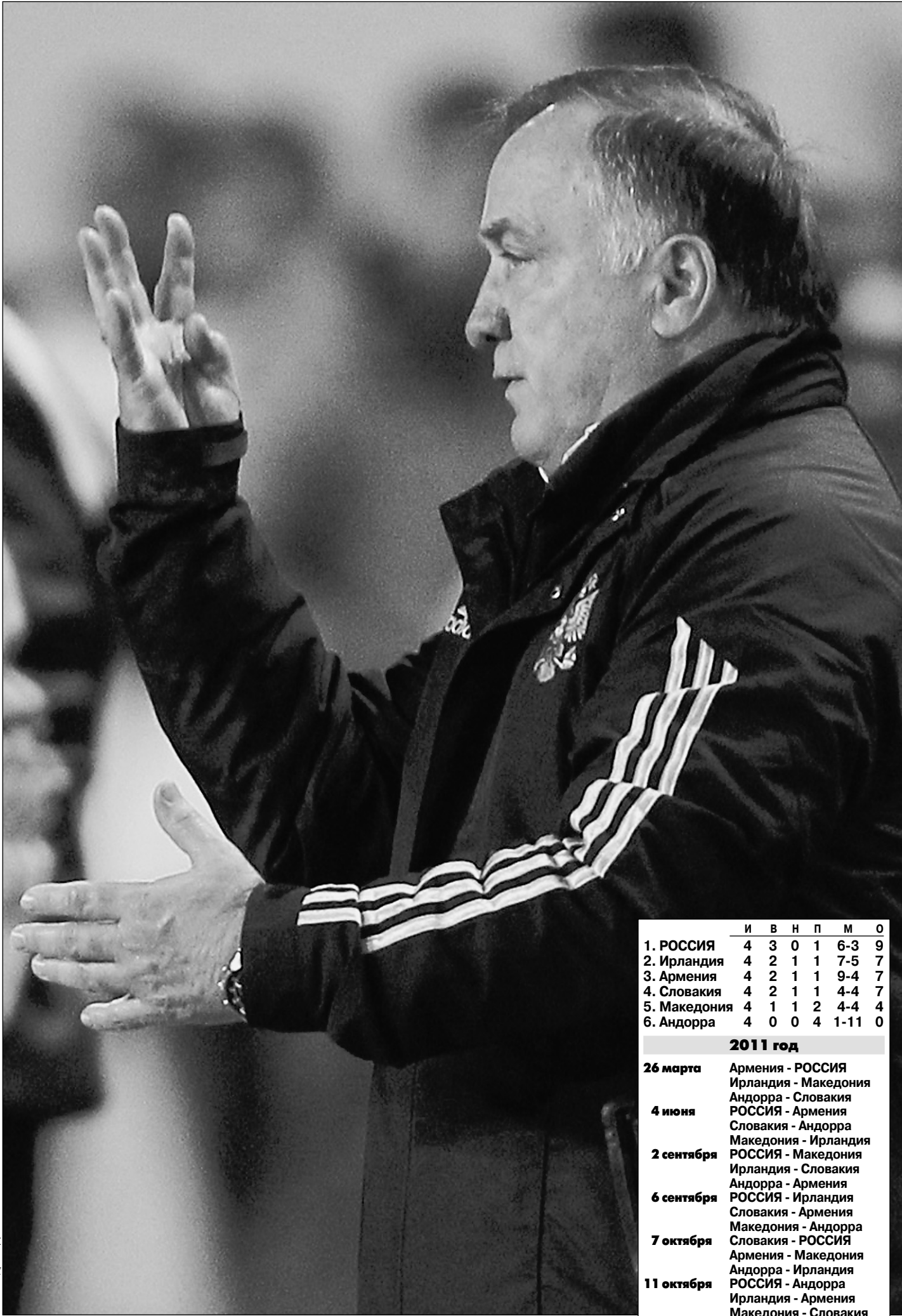
Вторник. Скопье. Македония - Россия - 0:1. Дик АДВОКАТ.