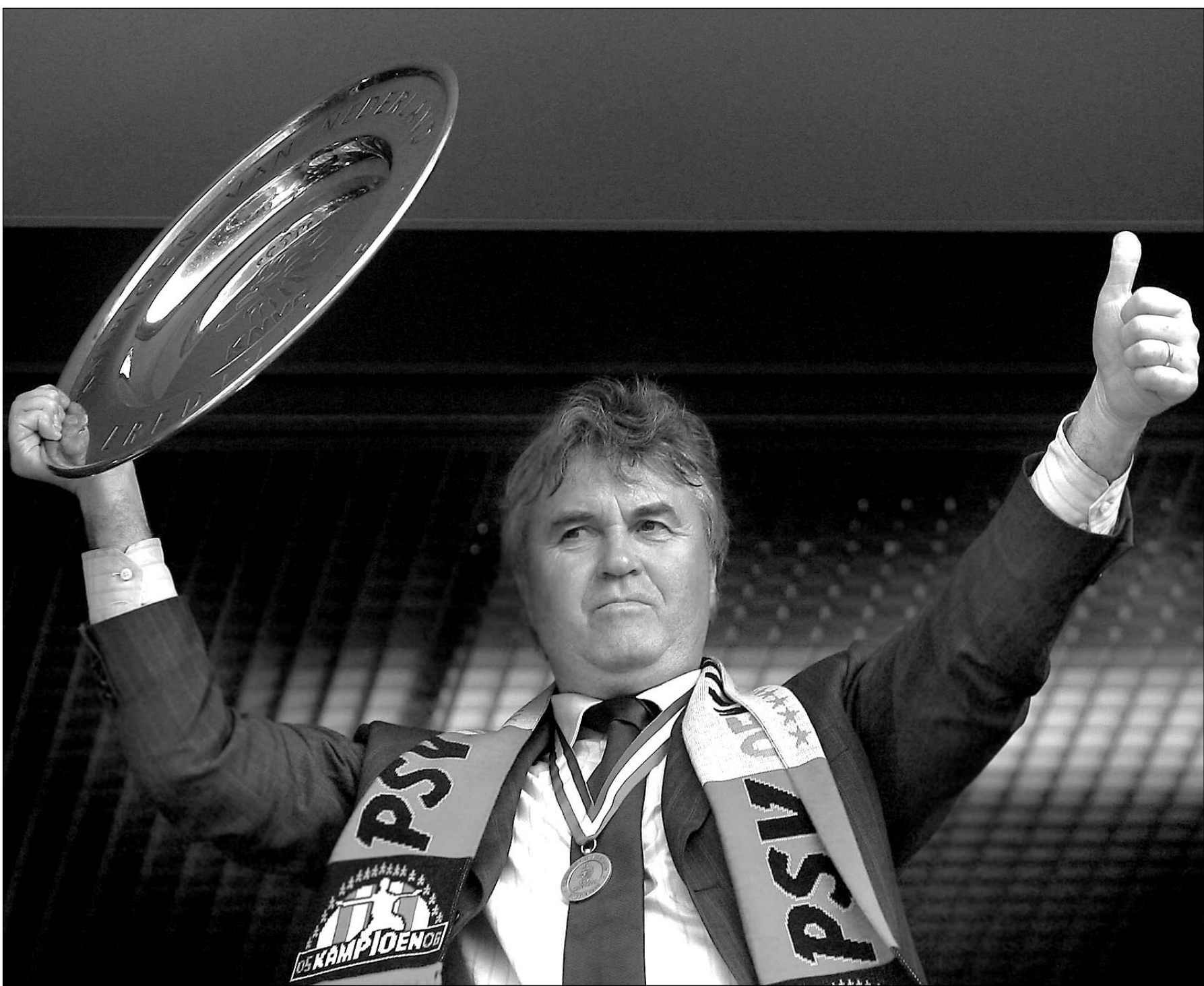
Воскресенье. Эйндховен. Гус ХИДДИНК в шарфе ПСВ и с призом чемпиона Голландии в руках. Надеюсь, что когда-нибудь он поднимет над головой победный трофей, а на шарфе будет написано: «Вперед, Россия!»

- Как вы считаете, почему столь именитый специалист согласился возглавить российскую команду?