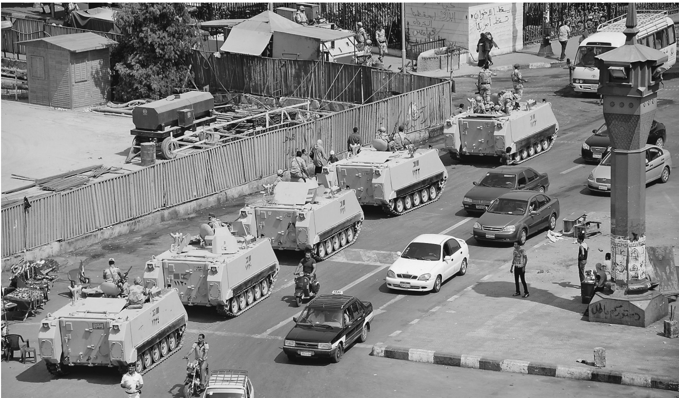
Во время ночного столкновения в Каире погибло и было ранено несколько десятков человек