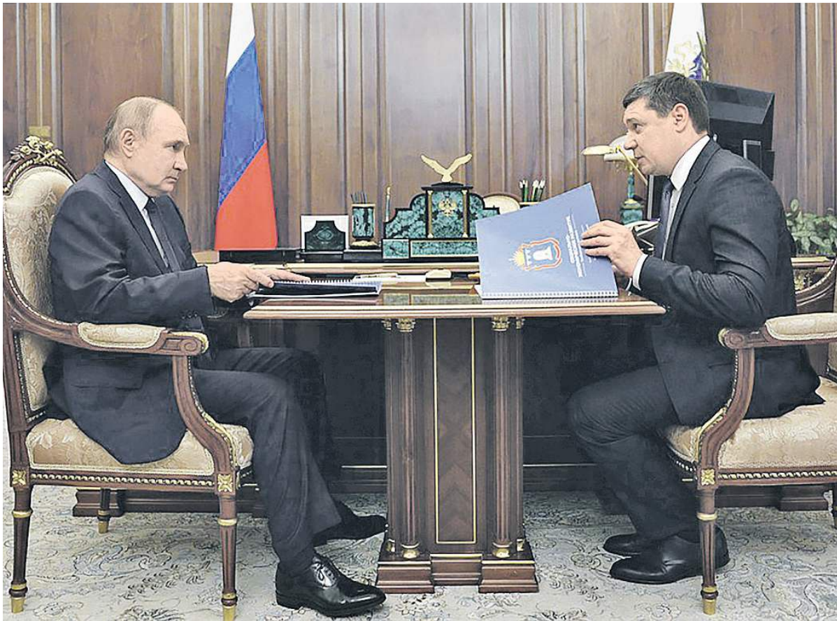
Встреча главы государства и главы региона.

Соседние регионы, по словам врио главы области, уже реализовали планы по созданию особой экономической зоны, получили новые рабочие места