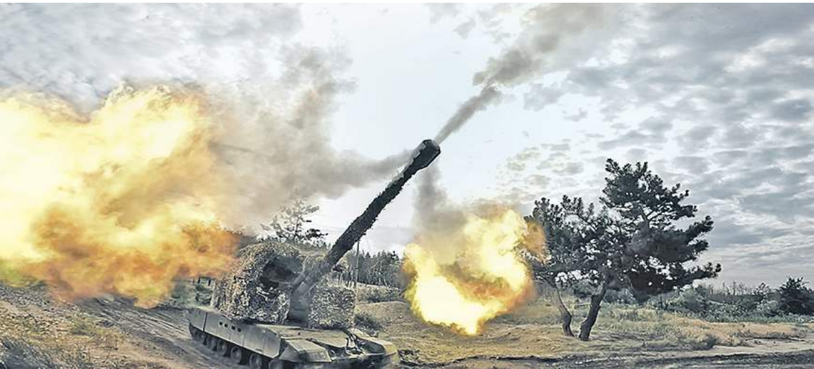
Точный огонь артиллеристов.

САУ 2С19, к несчастью для противника, не знает, что такое жалость