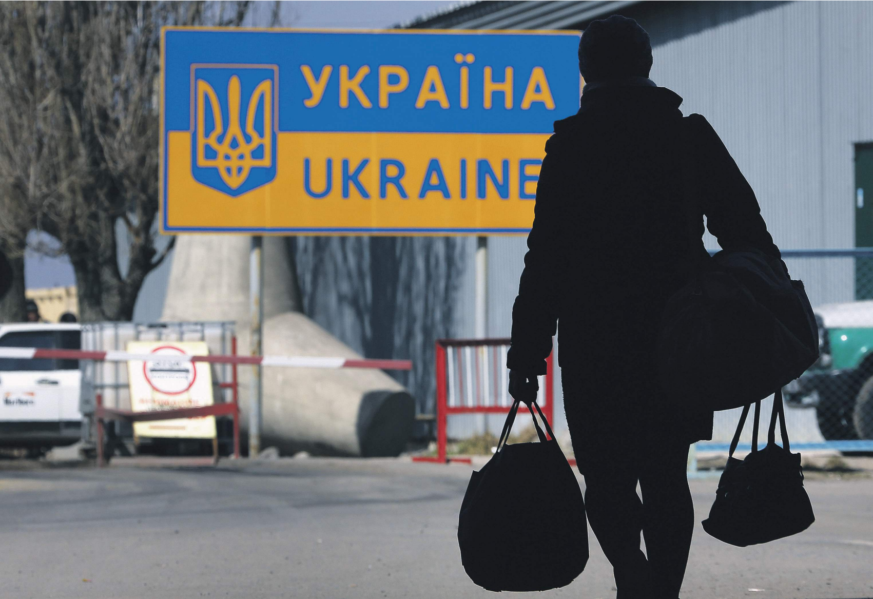
Украина заняла 133-е место по уровню ВВП на душу населения

В понедельник президент России Владимир Путин подписал указ о спе- циальных экономических мерах, ко- торые будут приняты в связи с анти- российскими санкциями