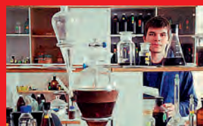
Почему ученые откладывают коммерциализацию новых технологий