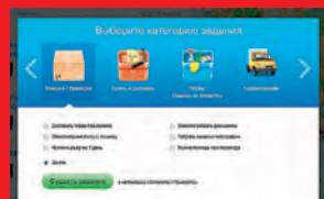
Мобильная платформа для особых поручений снижает рыночную цену любых услуг

ДРУГИЕ МАТЕРИАЛЫ ПРОЕКТА «НОВЫЙ БИЗНЕС»: http://expert.ru