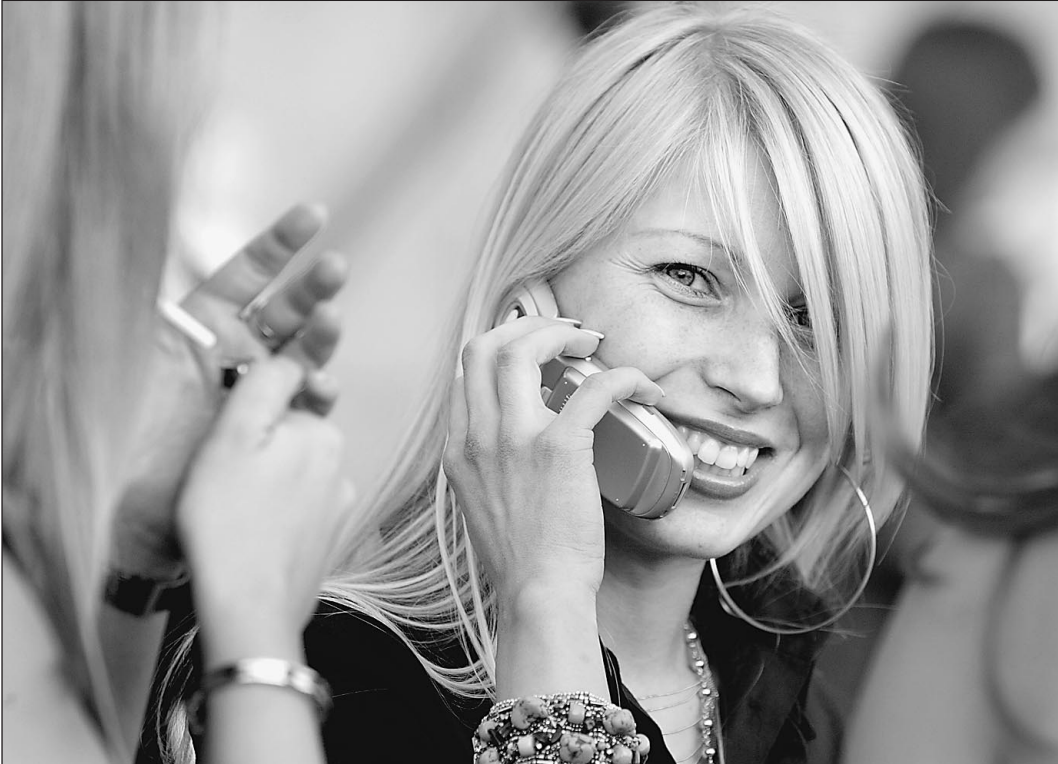
Между телефонным звонком...

местными бизнесменами, и они также выделили деньги (сумма по желанию спонсоров не раскрывается) — на них можно благоустроить сквер перед местным Театром драмы на центральной улице города и сквер имени Нестерова. Теперь жители города и спрашивают, в какой последовательности поступившие деньги тратить.