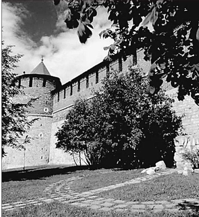
...и реконструкцией Нижегородского кремля теперь прямая связь

Обо всем этом ежедневно в 21 час в городском телеэфире звучат различные точки зрения на предмет того, какой именно объект стоит восстановить в первую очередь: вы-