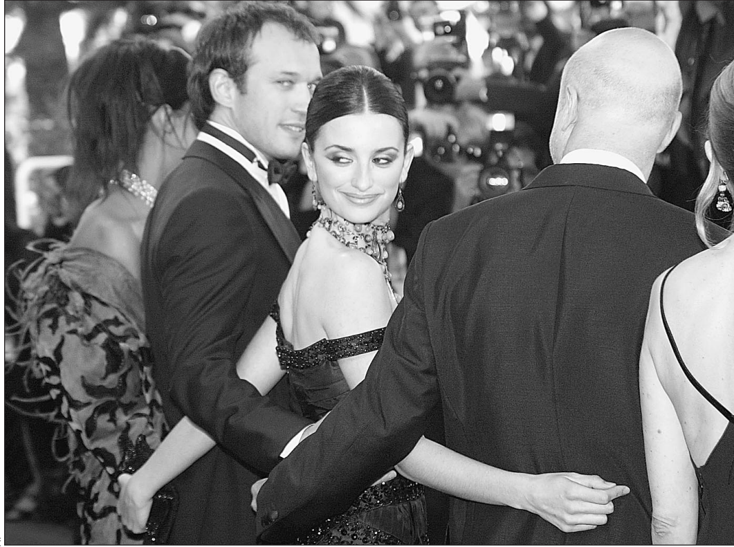
14 мая. Открытие кинофестиваля в Канне. Испанка Пенелопа Крус в объятиях французского актера Венсана Переса (слева) и продюсера Жерара Кравчука

Вчера президент России Владимир Путин внес в Госдуму проект амнистии чеченских боевиков, которые сдадут оружие до 1 августа 2003 года. Между тем война в республике идет своим чередом. Только за прошедшую неделю от терактов в Знаменской и Иласхан-Юрте погибло 75 человек. А вчера в Курчалое, Грозном, Аргуне и Назрани задержано 7 активных боевиков. Политики говорят о предстоящих выборах и возрождении Чечни, а оперативная группировка Воздушно-десантных войск усиливается дополнительным парашютно-десантным полком в 1000 человек. Война и мир существуют в Чечне параллельно, не пересекаясь. Специальный корреспондент «Известий» попытается соединить в одном репортаже эти две параллельные реальности.