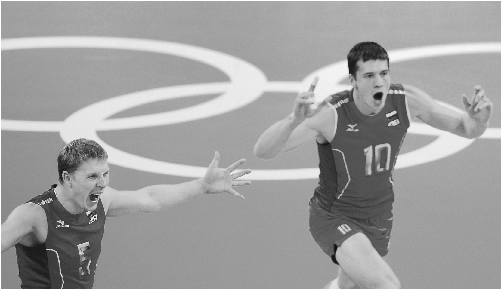
Наши волейболисты в тяжелейшем поединке с бразильцами завоевали золото Олимпиады