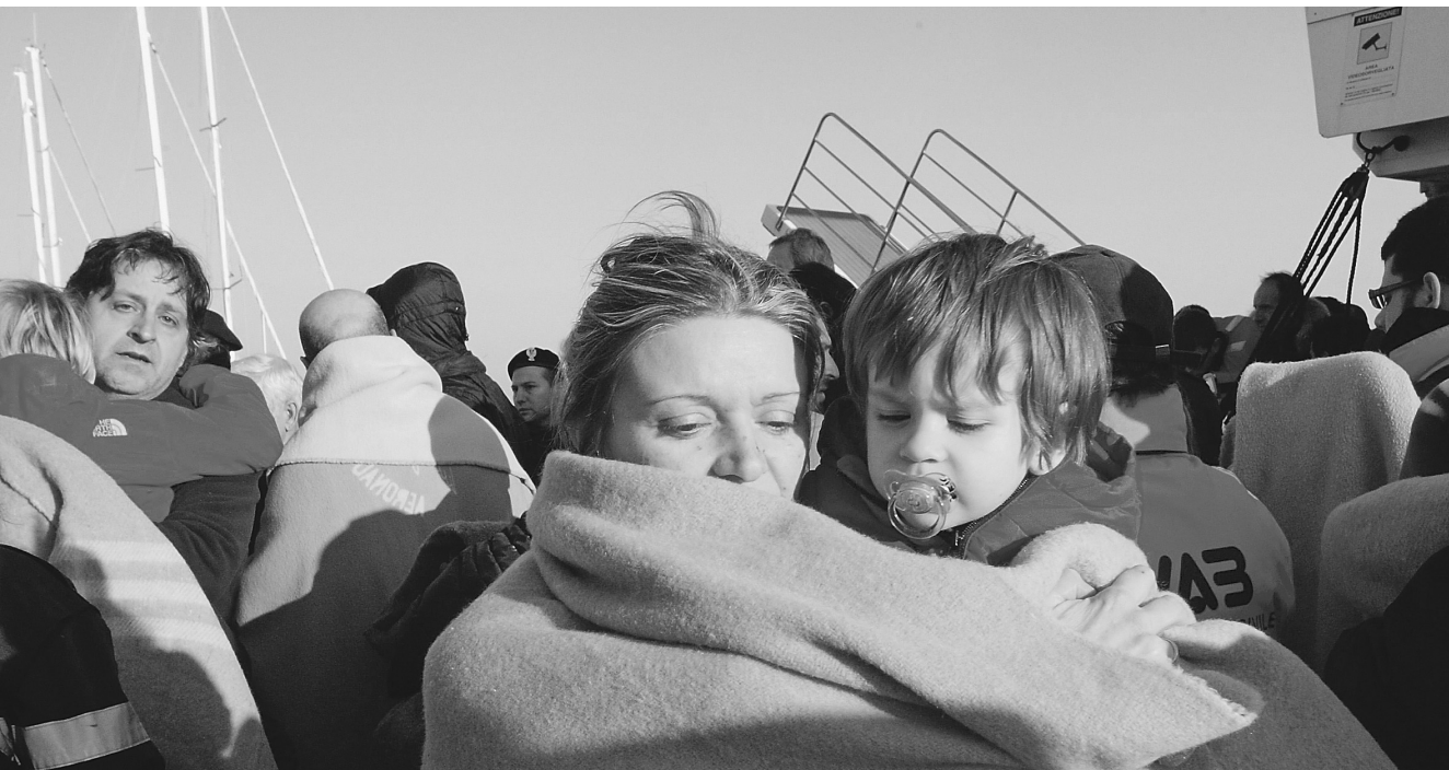
Благодаря тому, что катастрофа произошла рядом с берегом, в районе активного судоходства, жертв оказалось немного