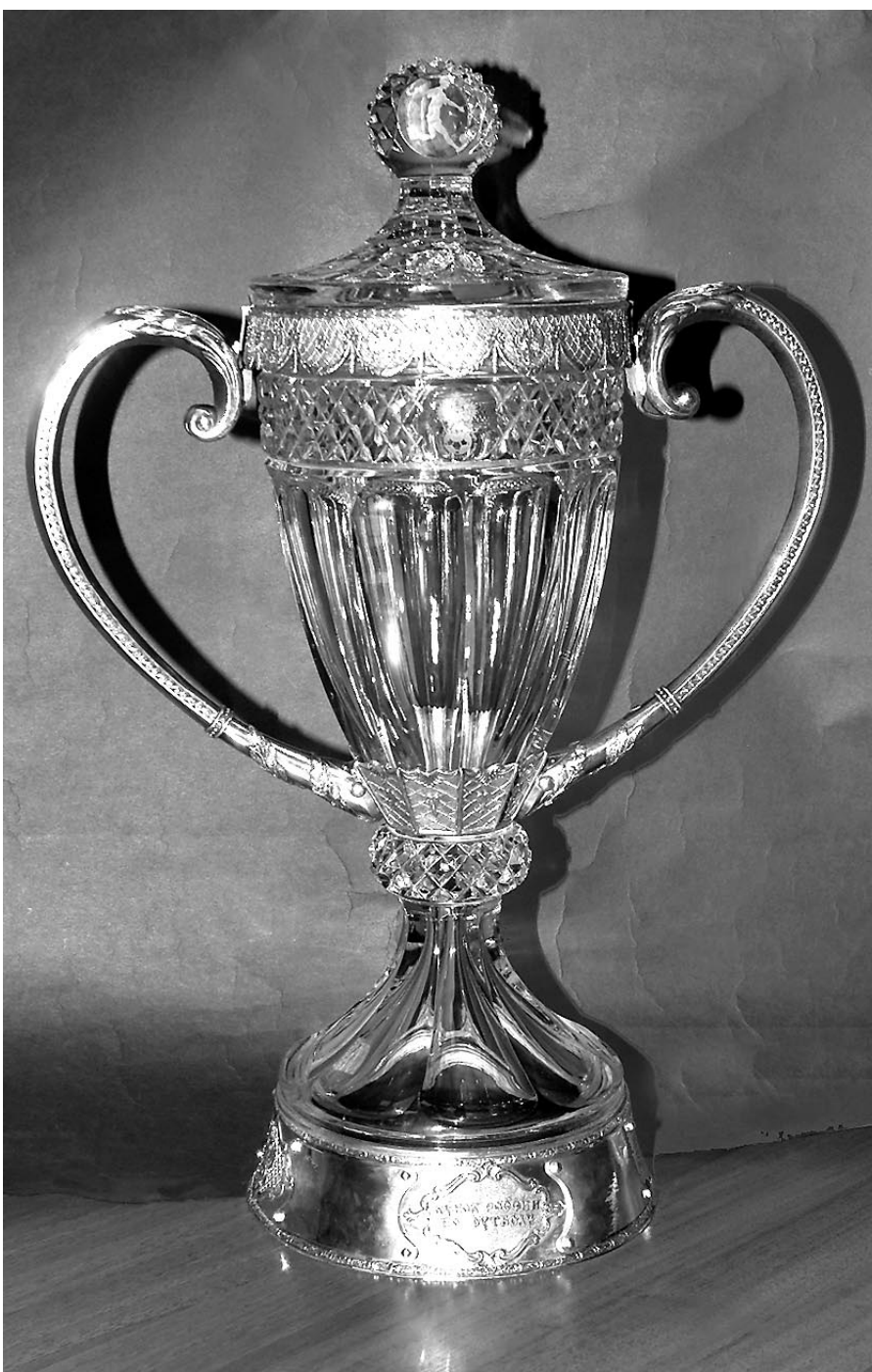
Дмитрий СОЛНЦЕВ - СЭ

Сегодня в полуфинальных матчах Кубка России-2002/03 встречаются «Лада» - «Спартак» и «Анжи» - «Ростов»