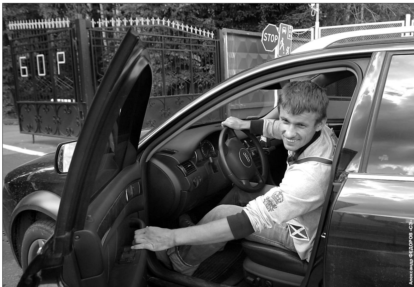
Вчера. Бор. Сергей СЕМАК прибыл на сбор перед матчем с Португалией.

езное предупреждение в связи с инцидентом, произошедшим на 27-й минуте матча Россия - Лихтенштейн, когда после первого гола Александра Кержакова с трибун на поле были брошены петарды. Поскольку до этого РФС после домашнего и выездного матчей с Латвией был подвергнут крупным денежным штрафам за аналогичные нарушения, в случае повторения ситуации сборная в будущем может быть наказана и проводить домашние встречи без зрителей. В связи с этим руководством РФС, а также тренеры и игроки сборной через «СЭ» обращаются к болельщикам с просьбой не бросать петарды с трибун. Напомним, что ЦСКА уже понес соответствующее наказание из-за группы болельщиков - домашнего матч Кубка УЕФА с датским «Мидтьюлландом», который состоится 15 сентября, пройдет при пустых трибунах.