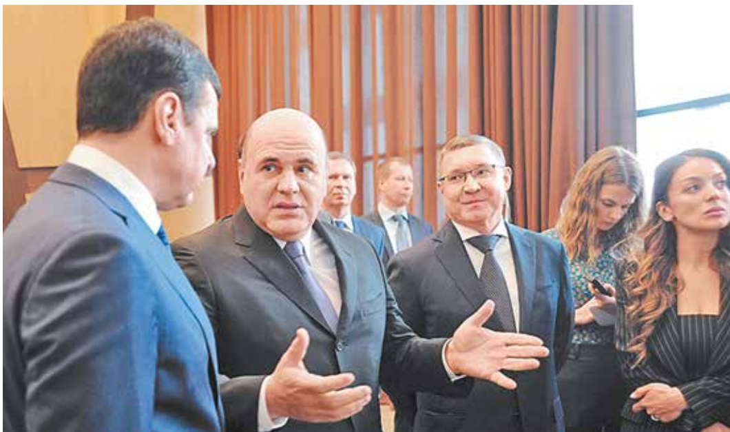
Председатель правительства РФ Михаил Мишустин и глава Минстроя России Владимир Якушев в кулуарах совещания о развитии малых городов

Модернизация коммунальной инфраструктуры станет основой развития небольших городов