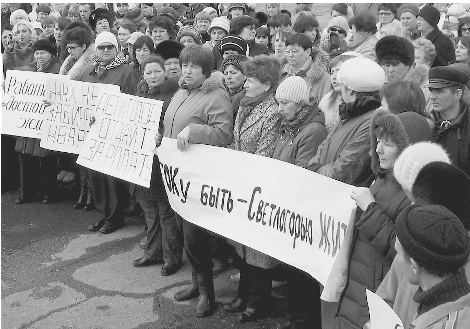
ЖИТЕЛЕЙ СВЕТЛОГОРЬЯ обманывали уже много раз, но они все равно пытаются добиться справедливости

«Известия» побывали в Светлогорье, где пытаются избавиться от вольфрамовой зависимости