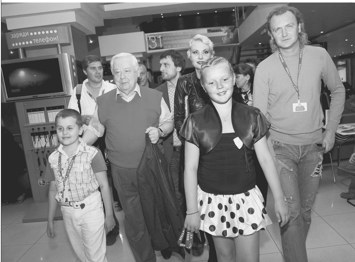
ОЛЕГ ТАБАКОВ, РЕНАТА ЛИТВИНОВА и юные актеры на премьере фильма «Мелодия для шарманки» в киноцентре «Октябрь»

Два дня в конкурсе ММКФ были отданы кино Восточной Европы: Болгария, Россия, Украина. Хотя назвать зарубежным режиссером представляющую Украину Киру Муратову язык не повернется. Ее фильмы все-таки — часть того пространства, что принято называть «русским кино». → стр. 10