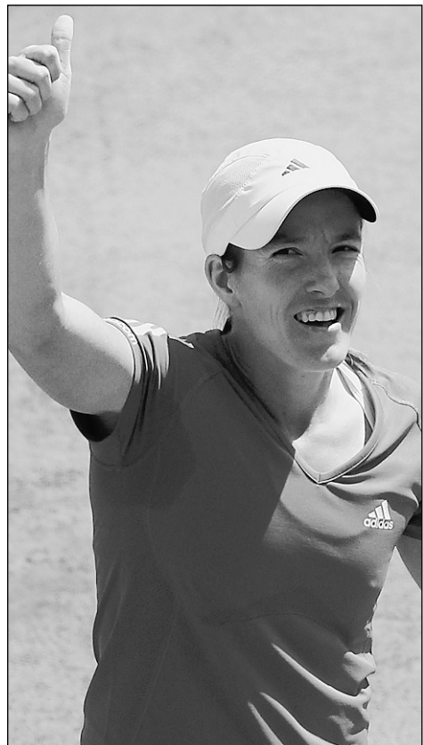
Вчера. Париж. Жюстин ЭНЕН побеждает чешку Клару Закопалову - 6:3, 6:3.