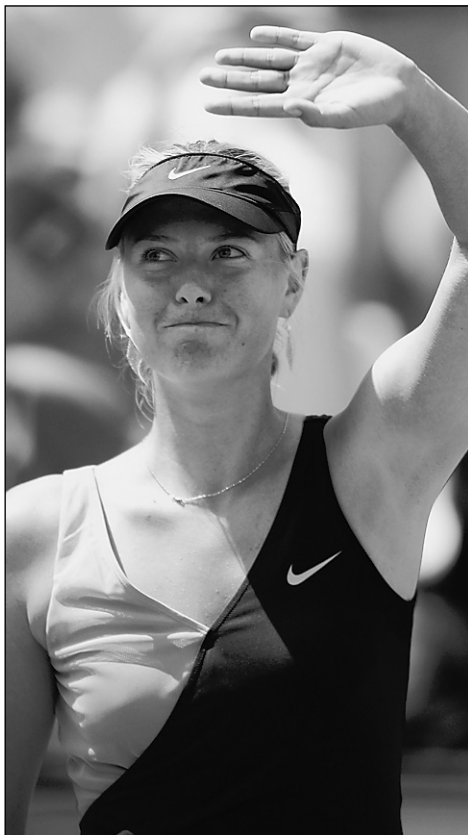
Вчера. Париж. Мария ШАРАПОВА побеждает бельгийку Кирстен Флипкенс - 6:3, 6:3.