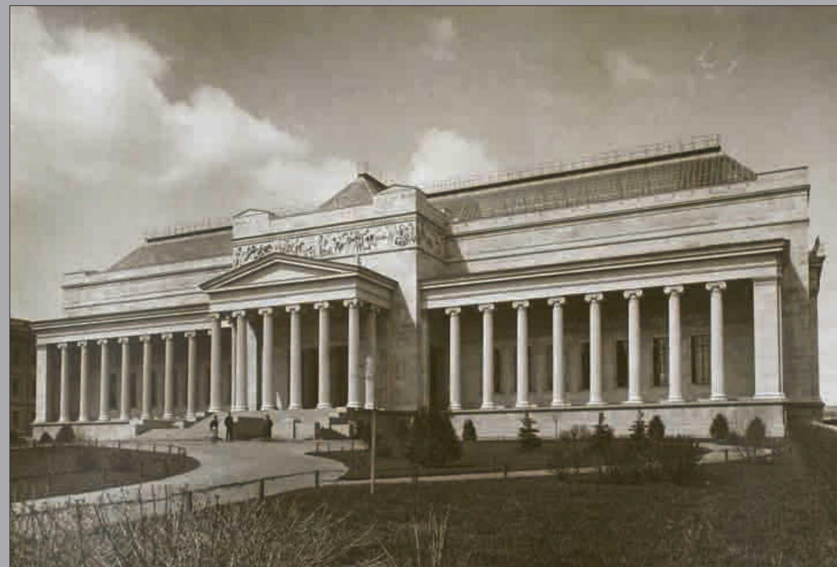
МУЗЕЙ ИЗЯЩНЫХ ИСКУССТВ ПЕРЕД ОТКРЫТИЕМ 31 МАЯ 1912 ГОДА.