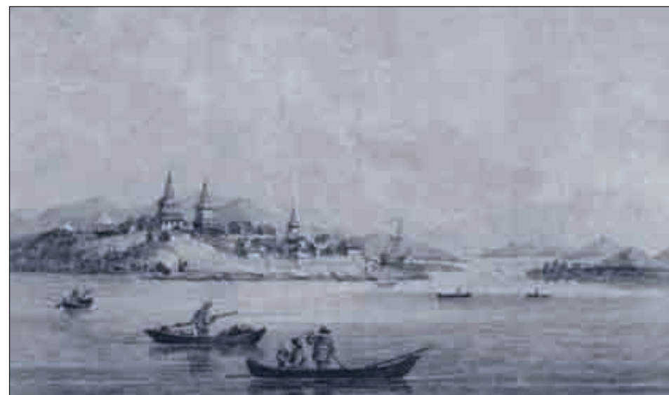
История Охотска — первого российского порта на Дальнем Востоке

Московский журнал. История государства Российского. № 6 (258). Июнь 2012