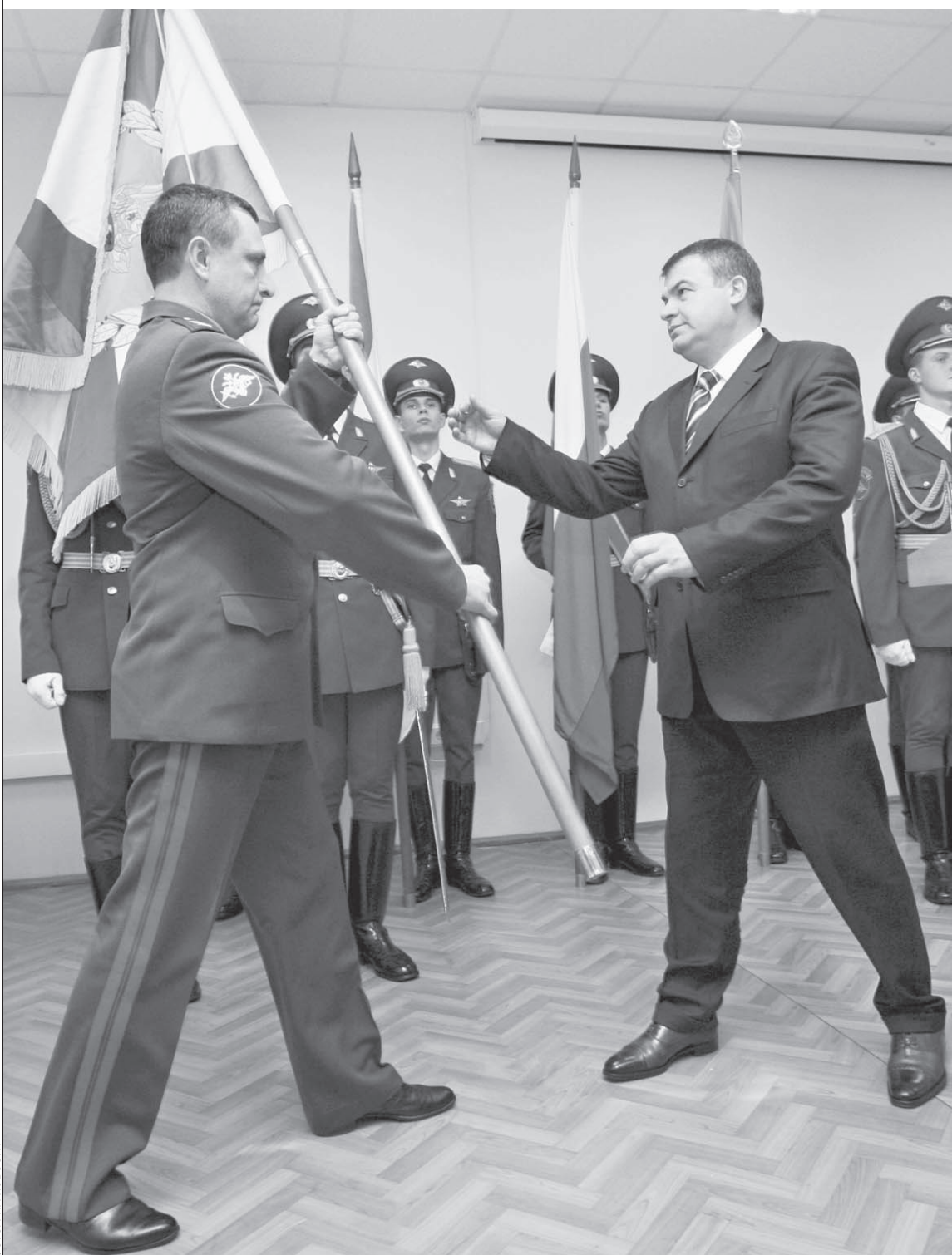
Штандарт министра обороны Анатолий Сердюков получил уже год назад, но только сейчас решил пойти в атаку

Анатолий Сердюков увольняет из армии медиков, журналистов и замов