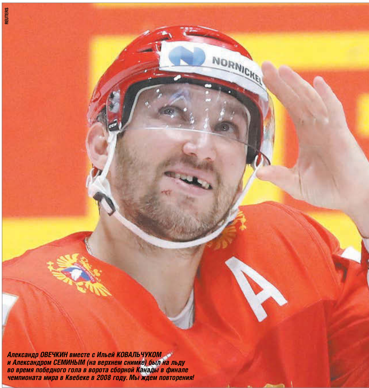
Александр ОВЕЧКИН вместе с Ильей КОВАЛЬЧУКОМ и Александром СЕМИНЫМ (на верхнем снимке) был на льду во время победного гола в ворота сборной Канады в финале чемпионата мира в Квебеке в 2008 году. Мы ждем повторения!

Сегодня на чемпионате мира состоятся два полуфинала: Россия сыграет с Финляндией, а Канада - с Чехией