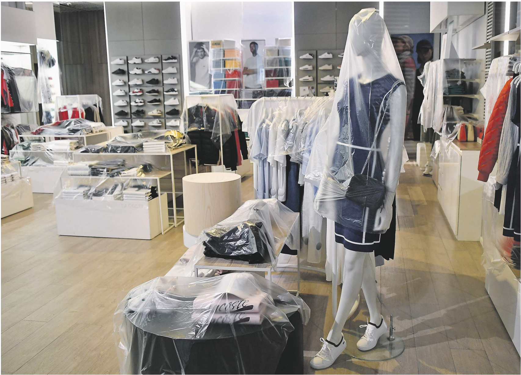
Алексей Карамзин / «Известия»