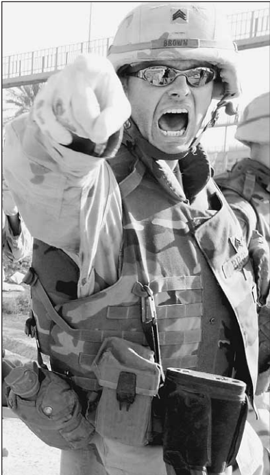
19 августа. Багдад. На месте теракта

«Мы останемся в Ираке», — заявил вчера Генеральный секретарь ООН Кофи Аннан, опровергнув слухи о свертывании миссии в Багдаде. Отель «Канал», в котором разместились ооновцы, представлял собой самую уязвимую цель в городе. Миссия ООН намеренно отказалась от услуг американских морских пехотинцев, чтобы не ассоциироваться с местными жителями с военными и быть «ближе к народу». У входа — лишь несколько охранников. Никто не ожидал, что у кого-то поднимется рука на безоружных ооновцев, приехавших обустроить