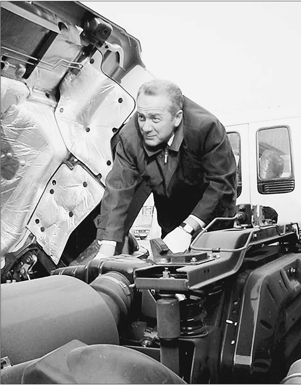
Губернатор Сахалинской области Игорь Фархутдинов пропал без вести