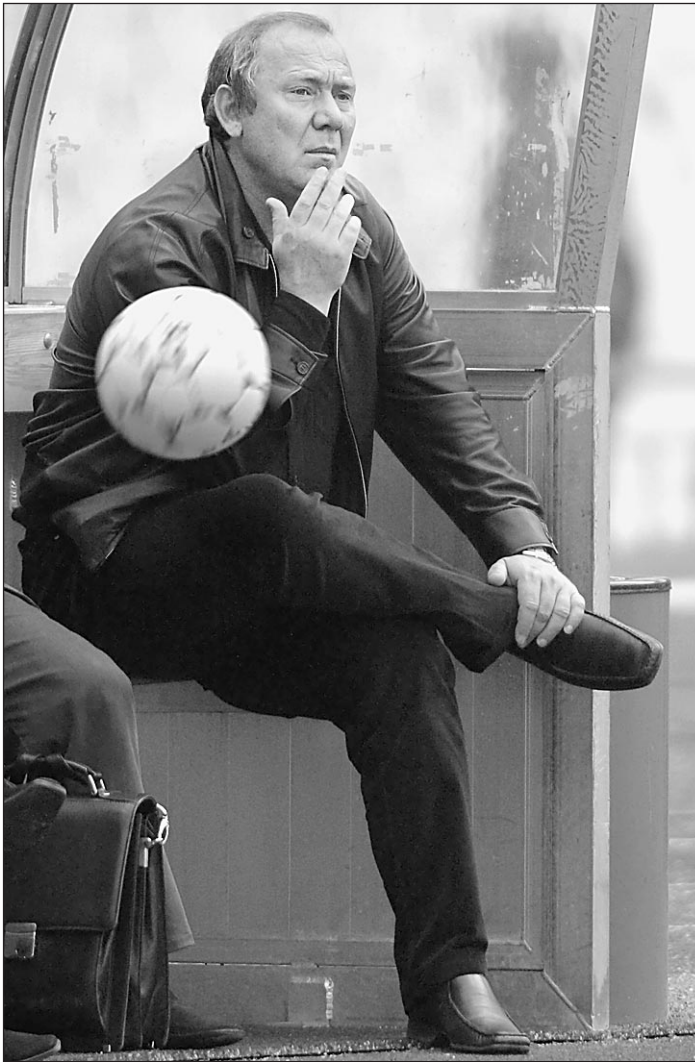
Так выглядит тренер «Сатурна»