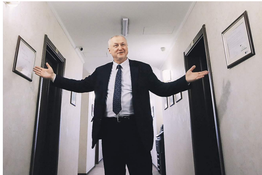
Генеральный директор РУСАДА Юрий Ганус сумел вернуть организацию в систему WADA