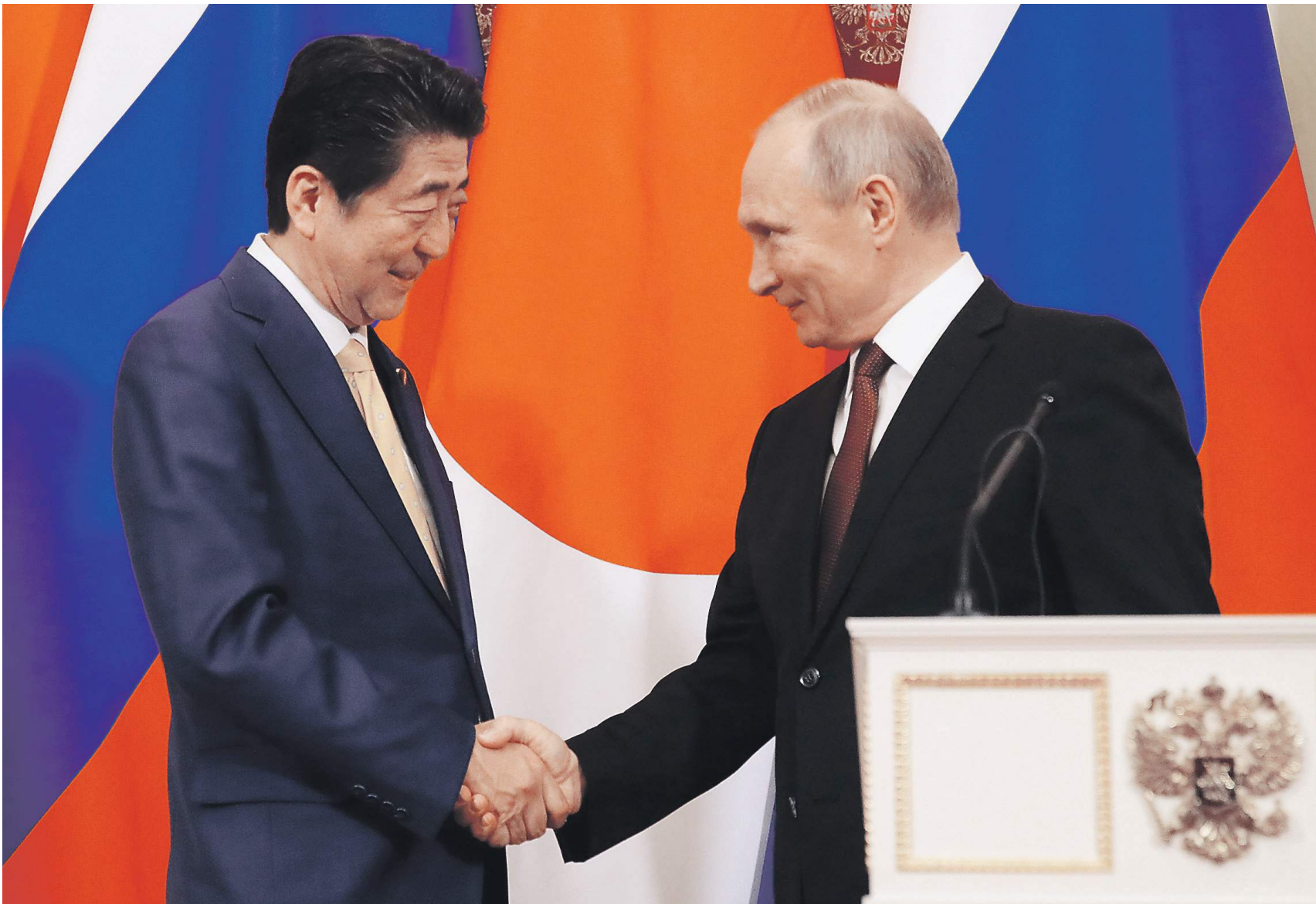
Личная дружба лидеров России и Японии не смогла сдвинуть с мертвой точки проблему мирного договора

В ответ японский премьер признался, что ему радостно вновь оказаться в России, и подчеркнул, что планирует «как следует» обсудить вопросы заключения мирного договора.