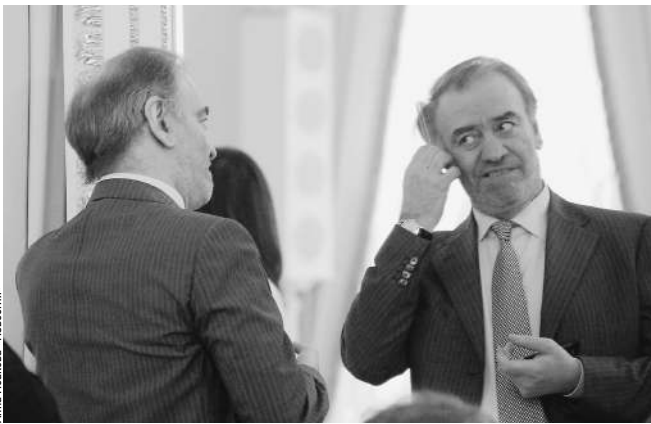
Мэстро еще не до конца определился в своих претензиях

Депутаты настаивают на индексации военных выплат