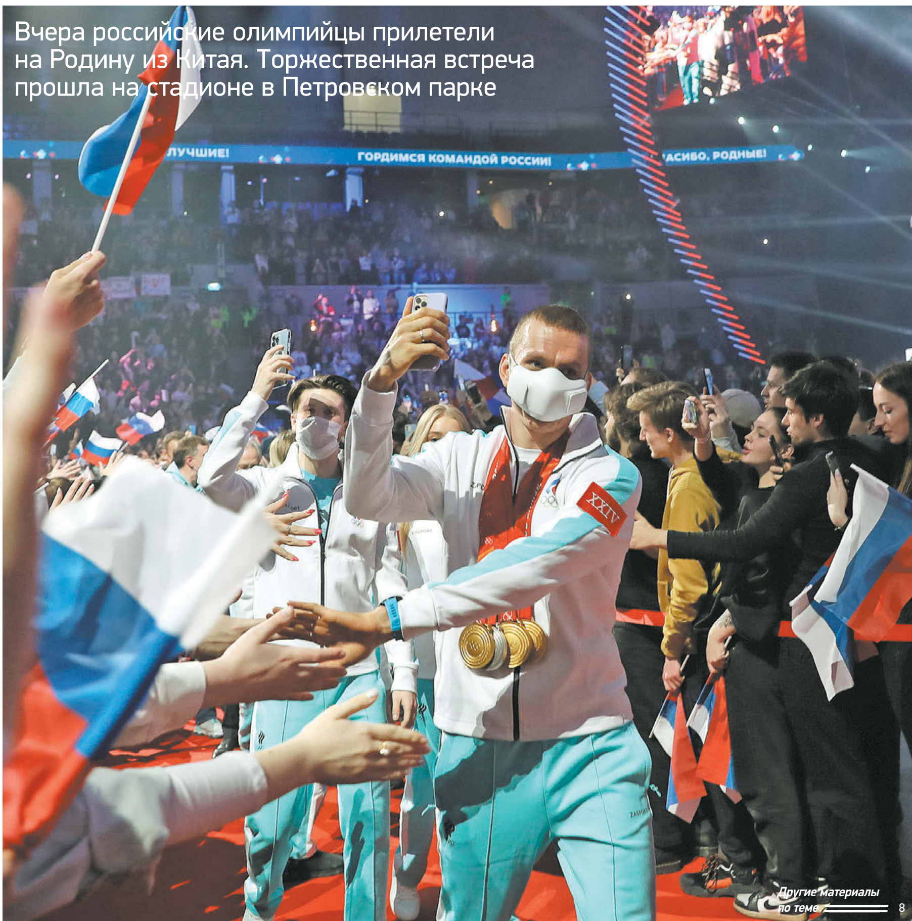
Вчера. Москва. Петровский парк. Олимпийский чемпион Александр Большунов (на переднем плане) приветствует болельщиков

Вчера российские олимпийцы прилетели на Родину из Китая. Торжественная встреча прошла на стадионе в Петровском парке