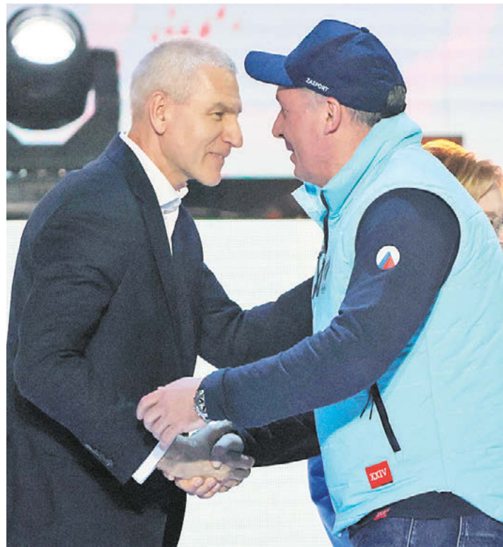
Министр спорта РФ Олег Матыцин и президент ОКР Станислав Поздняков