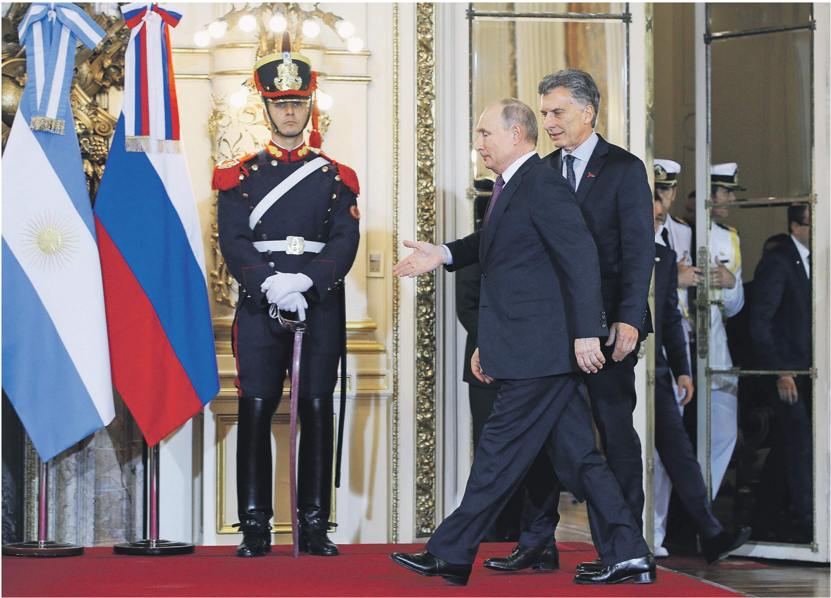
График президента в Буэнос-Айресе оказался крайне насыщенным