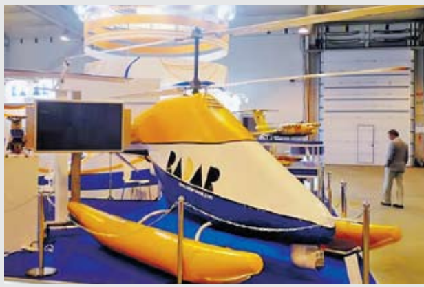
По сообщениям корреспондентов «ВПК», информгентств АРМС-ТАСС и Интерфакс-АВН

ристиками: диаметр несущего винта — шесть метров, высота — 2,850 метра, длина со сложенными лопастями — 6,100 метра, взлетная масса — 500 килограммов, масса аппаратуры полезной нагрузки — 180 килограммов, дальность ведения разведки — 550 километров, время полета — восемь часов, диапазон высот применения — 50–4000 метров, максимальная скорость полета — 180 километров в час.