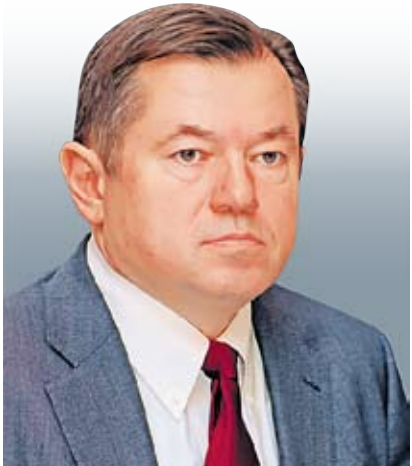
Сергей ГЛАЗЕВ, директор Института новой экономики Государственного университета управления, академик РАН