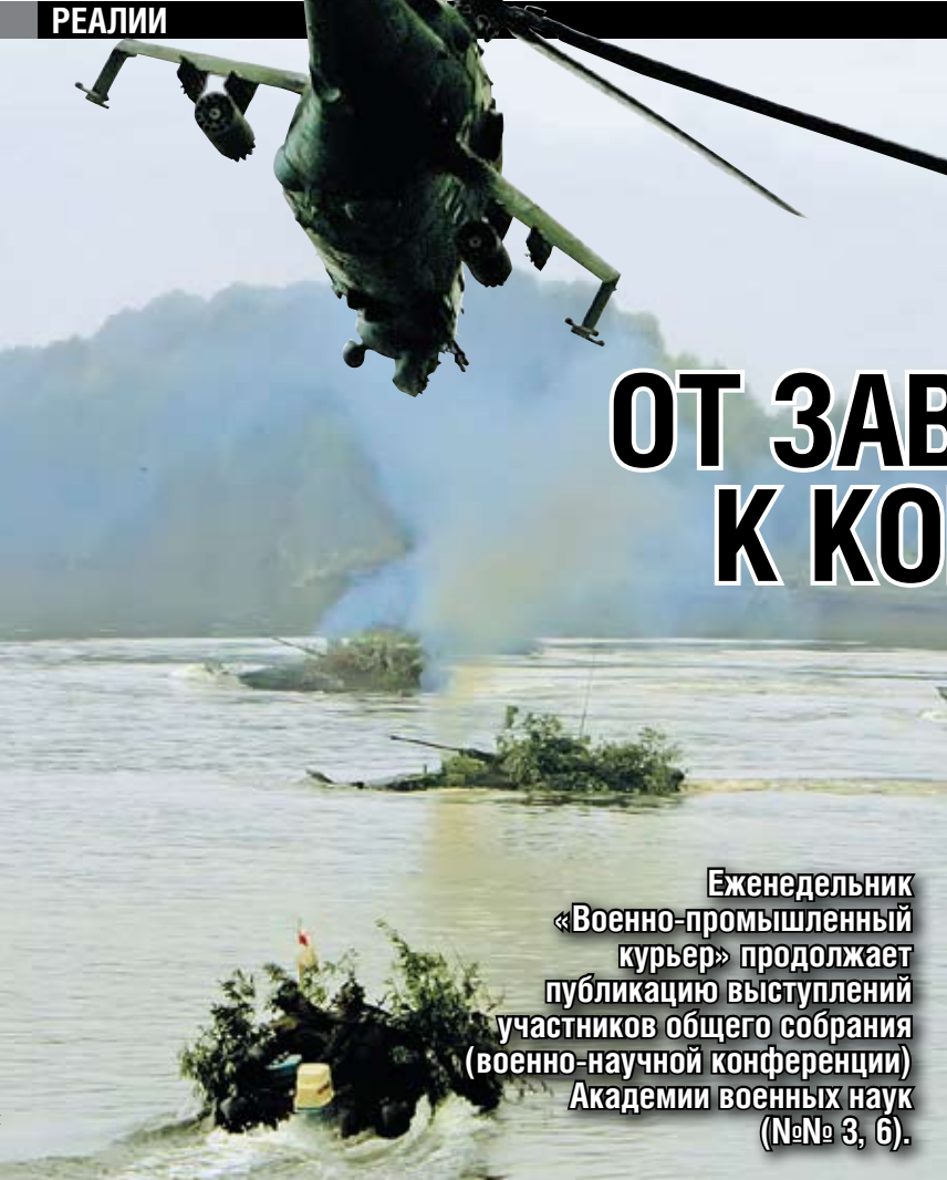
Еженедельник «Военно-промышленный курьер» продолжает публикацию выступлений участников общего собрания (военно-научной конференции) Академии военных наук (№№ 3, 6).