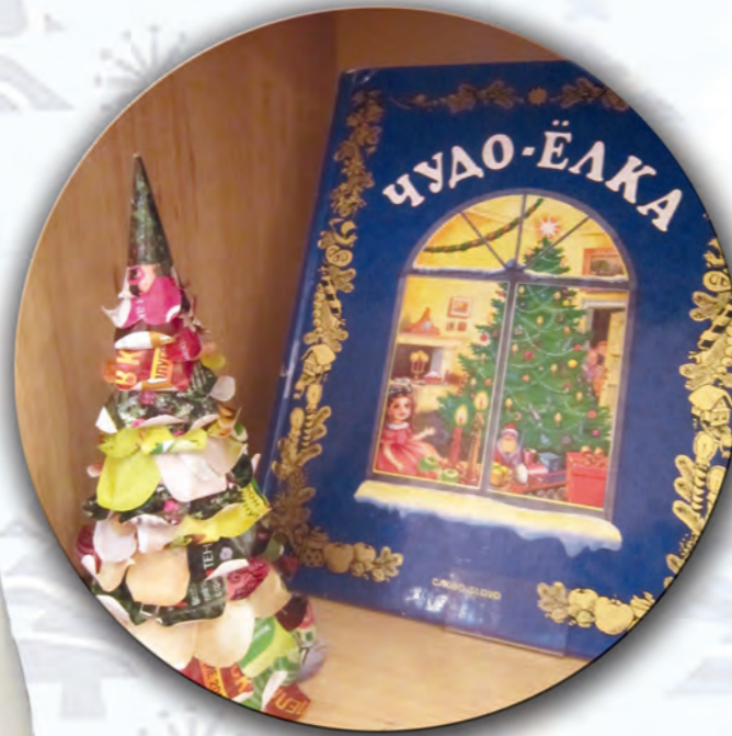
Серия «БИБЛИОТЕЧНЫЕ ПОДЕЛКИ ИЗ СТАРЫХ ЖУРНАЛОВ». Зима