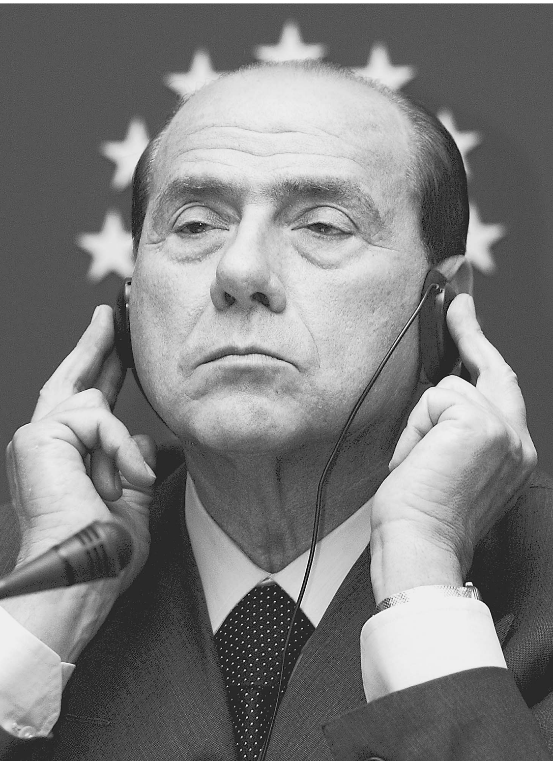
Итальянский премьер Сильвио Берлускони — один из главных адвокатов России в ЕС

Прошедший вчера в Брюсселе экстренный саммит ЕС, посвященный отношениям с Россией, в очередной раз продемонстрировал: Европа расколота. Конечно, участники встречи старательно изображали единство, но это им не слишком удалось. Проанализировав последние действия и высказывания европейских лидеров, «Известия» попытались «классифицировать» 27 стран объединенной Европы, составить своеобразный «рейтинг русофобии». Или, если хотите, русофилии. Вот что из этого получилось.