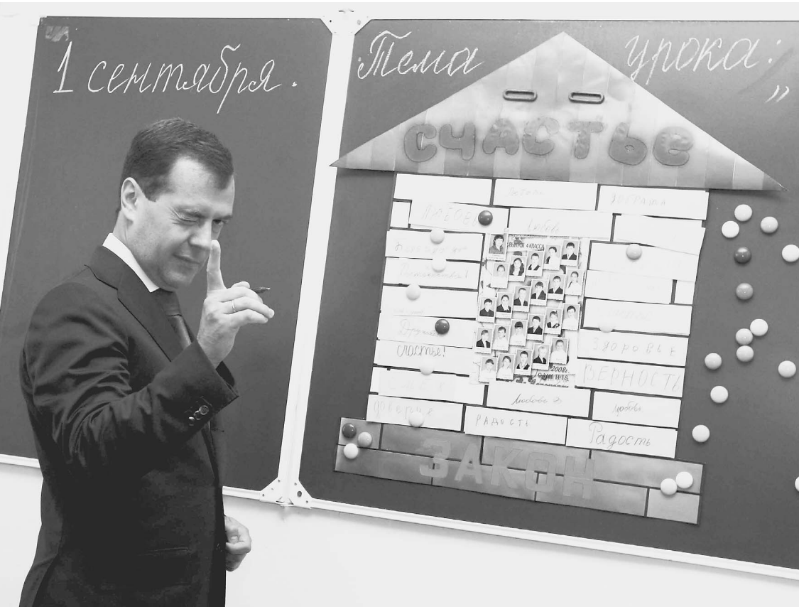
В День знаний президенту пришлось сдать экзамен по рисованию. Он изобразил себя рядом со школьниками. «Дима — это буду я»

1 сентября президент отпраздновал в почти родном для себя городе Кореновске Краснодарского края. С первоклашками он обсудил пользу сосисок для здоровья, пятиклассникам рассказал о том, что в его понимании крепкая семья, а девятому классу посоветовал не только уроки по вечерам учить, но и отдыхать и заниматься спортом. → стр. 2