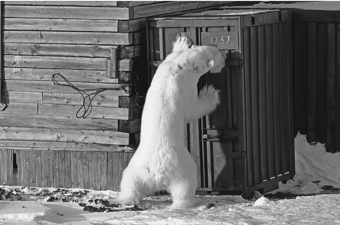
Главное, чтобы белый медведь не добрался до ядерной кнопки

Ядерных полигонов на планете меньше, чем космодромов. Когда-то у нашей страны было три ядерных полигона. Но от Семипалатинска России пришлось отказаться, а Капустин Яр под Астраханью перестал использоваться, поскольку жителей стало жалко. Теперь у России остался последний ядерный полигон на Новой Земле в Ледовитом океане. Эти острова, которые по площади в 2 раза больше Голландии, открыл голландец Баренц. Капитан нашел на архипелаге вечный упокой, потому что человеку здесь невыносимо. Архипелаг заселяли лишь белые медведи и олени. Когда в 1954 году в СССР было решено создать полигон для особо крупных бомб, недостатки Новой Земли превратились в достоинства. Атомная бомба принесла на архипелаг цивилизацию. → стр. 9