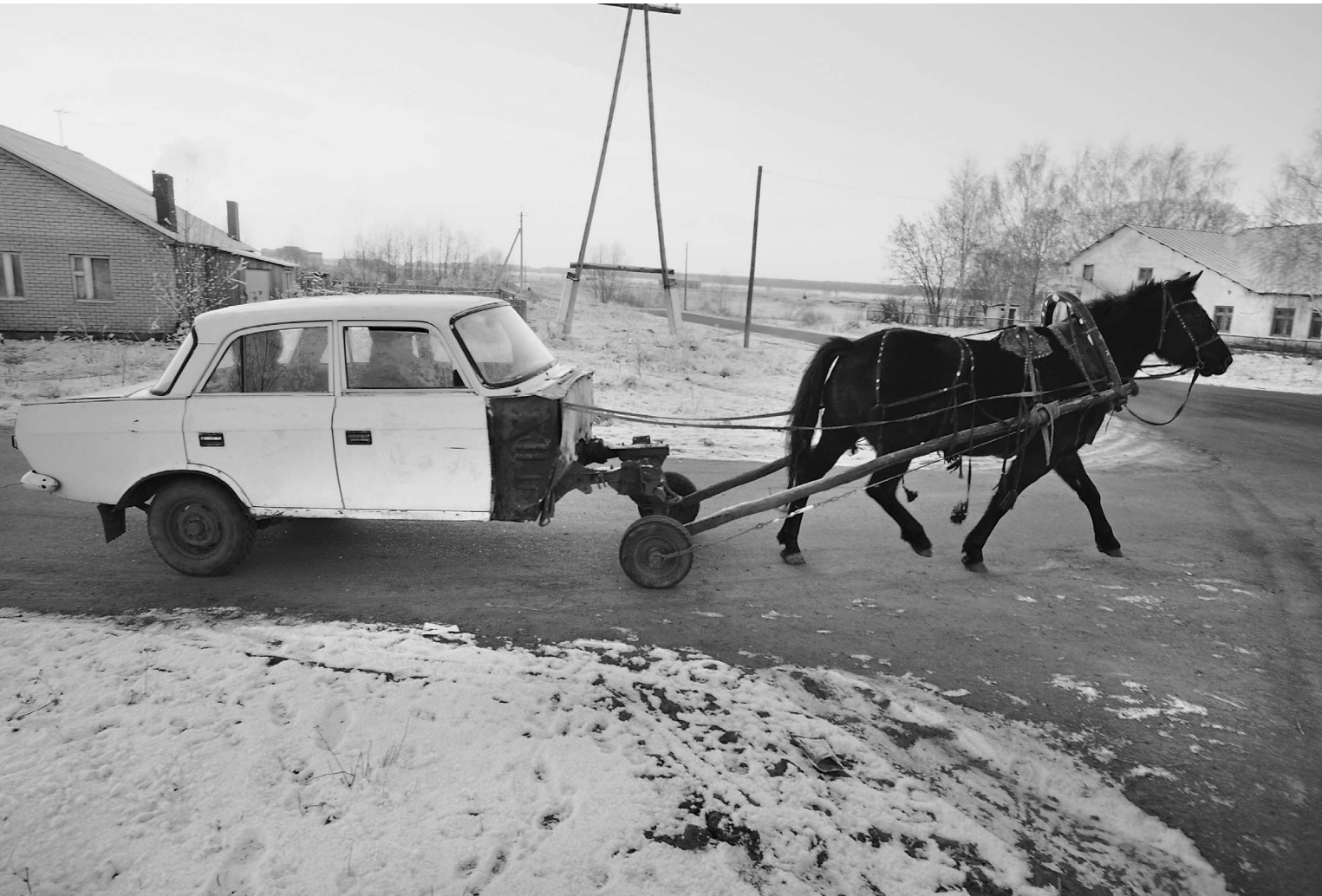
Лошадиные силы депутаты хотели сделать «золотыми», но передумали

Теперь депутаты хотят его не повысить, а понизить