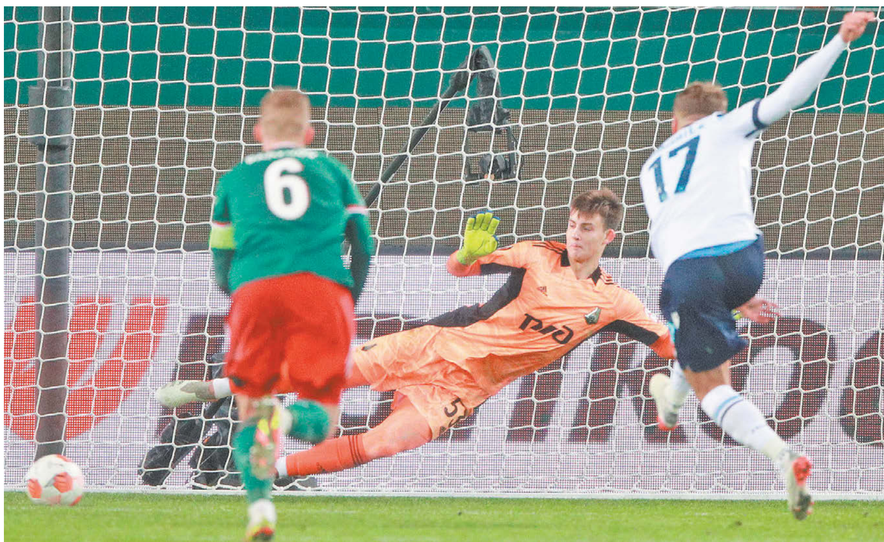
Вчера. Москва. Черкизово. «Локомотив» – «Лацио» – 0:3. 56-я минута. Чиро Иммобиле открывает счет с пенальти

Вчера «Локомотив» крупно проиграл «Лацио» в матче Лиги Европы (0:3). Еще до начала встречи появилась информация о том, что немецкий идеолог перестройки железнодорожного клуба скоро окажется в «МЮ»