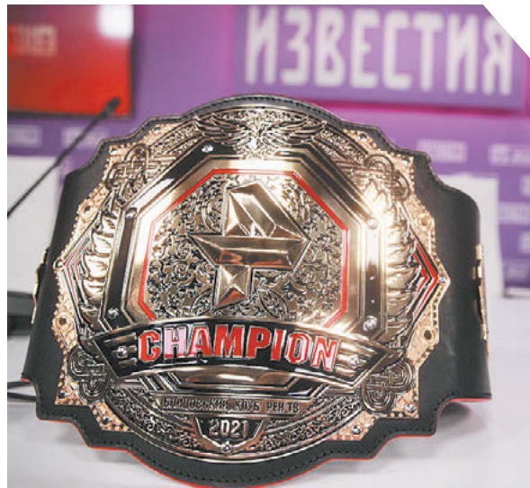
Зураб Джанахадзе «Известия»