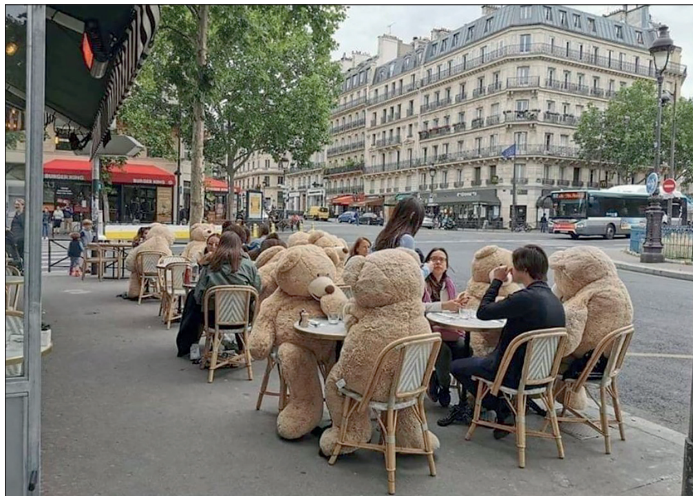
Плюшевые медведи помогают парижским кафе соблюдать нормы социальной дистанции.

потерял, по оценке Минфина, федеральный бюджет России от одного лишь снижения экономической активности в связи с пандемией