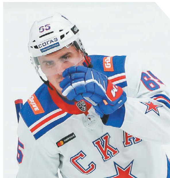
Федор Успенский «СЭ» / Canon EOS-1DX Mark II