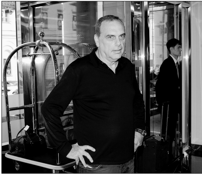
Вчера. Москва. Авраам ГРАНТ.

Как уже сообщал «СЭ», в Москве побывал новый главный тренер «Вест Хэма». Вчера с ним побеседовал корреспондент «СЭ».