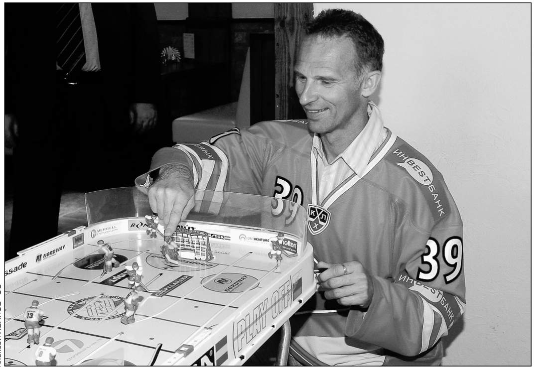
Вчера. Москва. Сокольники. Первая игра легендарного Доминика ГАШЕКА в России.