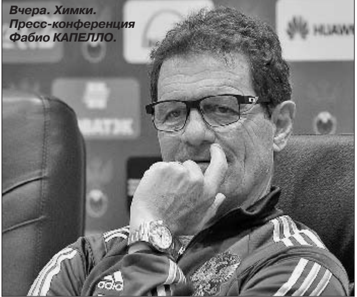
Вчера, Химки. Пресс-конференция Фабио КАПЕЛЛО.

Сегодня сборная России начинает новую жизнь. Со старым главным тренером.