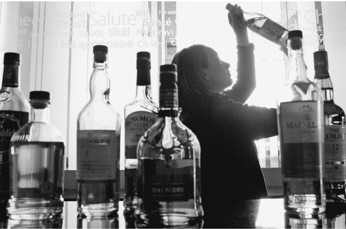
«Солодосодержащую жидкость» неизвестного происхождения можно купить и по нормальной цене