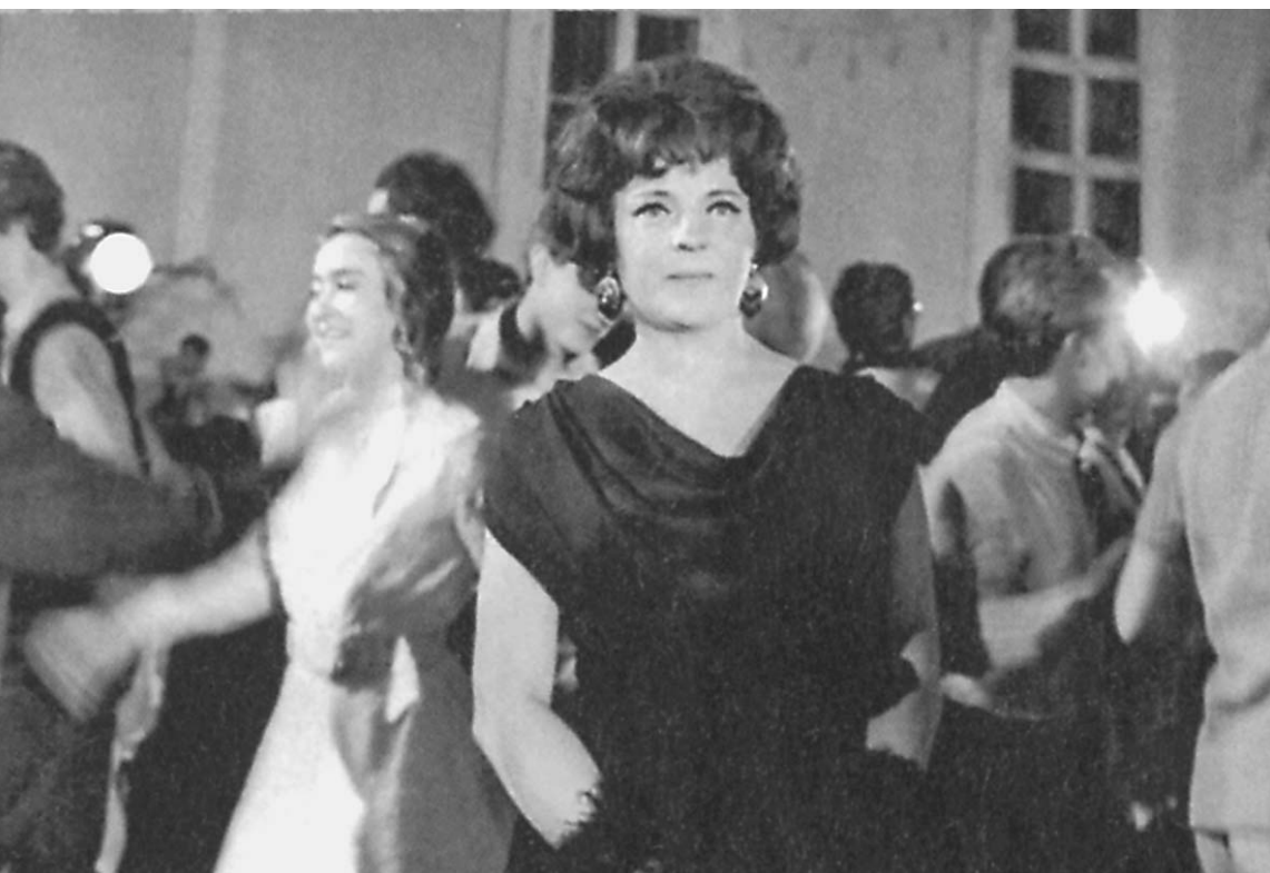
Зинаида Шарко в фильме «Долгие проводы», 1971 год

У народной артистки России Зинаиды Шарко — юбилей. Возраста она не скрывает — 80. Да и что скрывать — энергии у Зинаиды Максимовны хватит на дюжину двадцатилетних коллег — спектакли в родном БДТ, гастроль, воспитание правнука... Собору «Известий» в Санкт-Петербурге Ирине Тумаковой удалось встретиться с легендарной актрисой после очередной репетиции. → стр. 10