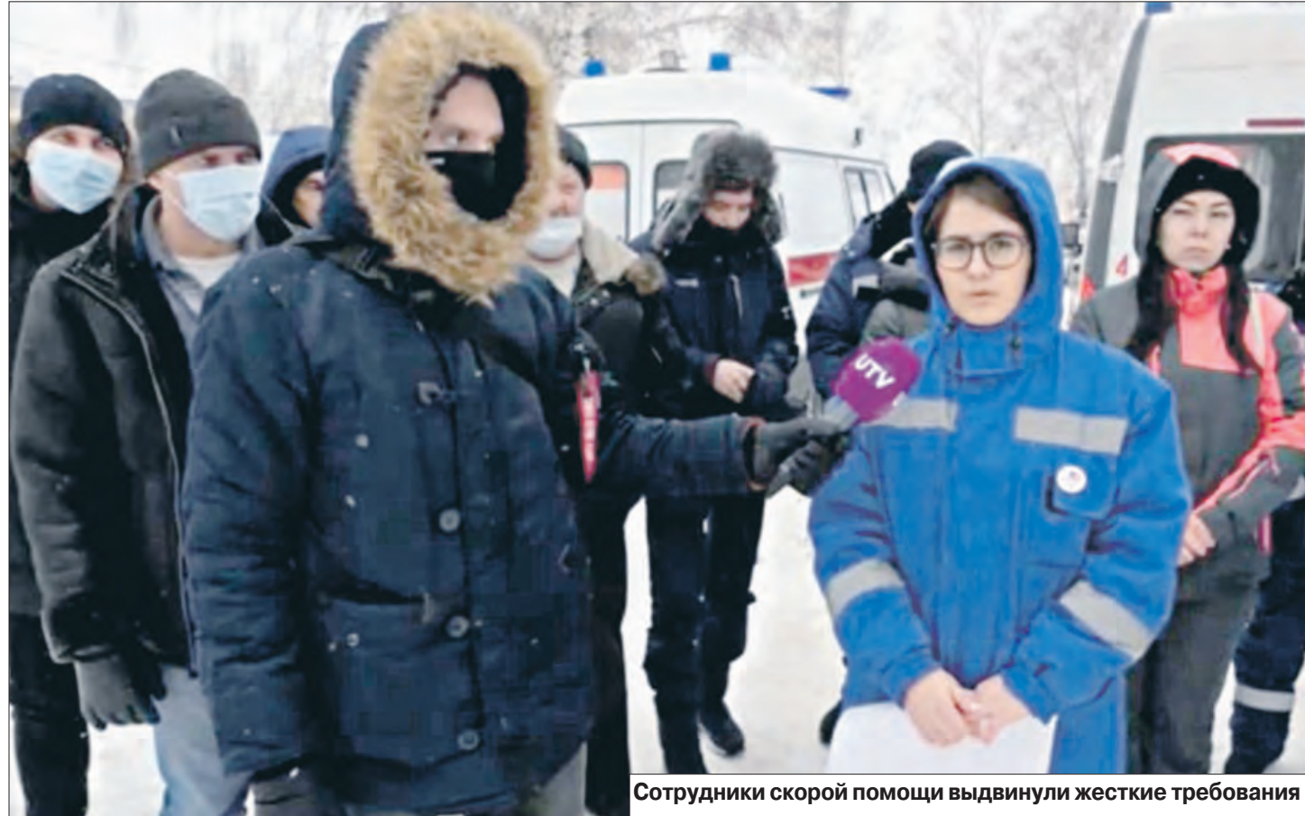
Сотрудники скорой помощи выдвинули жесткие требования