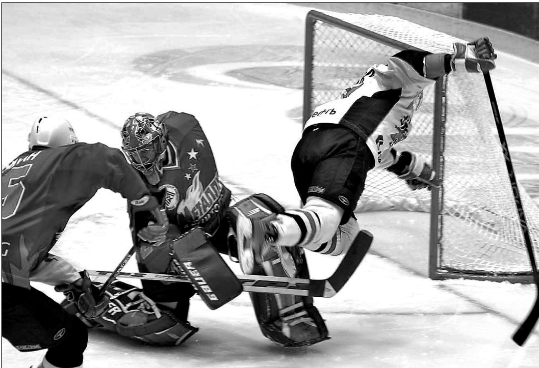
Вчера. Омск. «Авангард» - «Металлург» Мг - 2:4. Дебютант гостей Евгений НАБОКОВ так и не дал омской суперзвезде Яромиру ЯГРУ шанса забросить хоть одну шайбу.

- Нагрузка в суперлиге, пожалуй, помнее, но это из-за того, что наш хоккей заметно