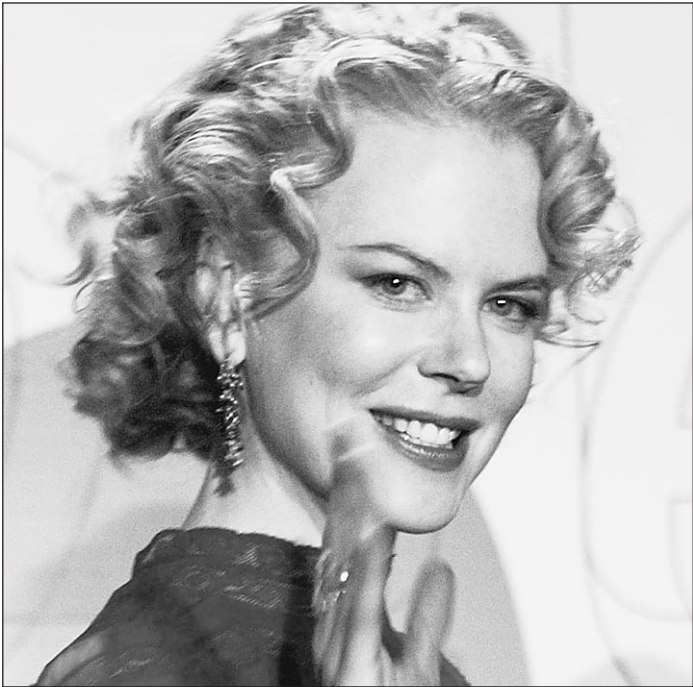
Главную роль на Берлинском кинофестивале играет Николь Кидман 8

British Petroleum решила вложить в российский бизнес $6,75 миллиарда