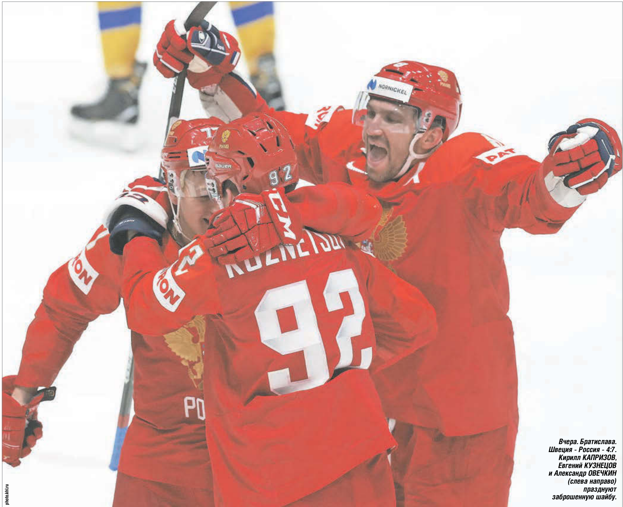
Вчера, Братислава. Швеция - Россия - 4:7. Кирилл КАПРИЗОВ, Евгений КУЗНЕЦОВ и Александр ОВЕЧКИН (слева направо) празднуют заброшенную шайбу.

В последнем матче группового этапа сборная России разгромила действующего победителя чемпионата мира - Швецию (7:4), забросив шесть шайб во втором периоде. В четвертьфинале россияне, которые одержали семь побед подряд, завтра сыграют против США.