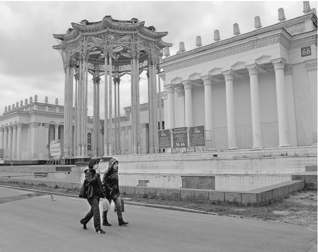
Павильон 66 может стать географическим центром