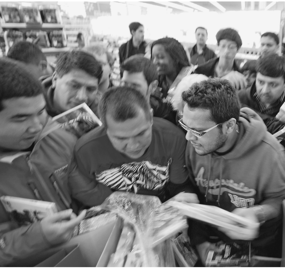
Сограждане смогут приобщиться к американской народной забаве — «черной пятнице» распродаж