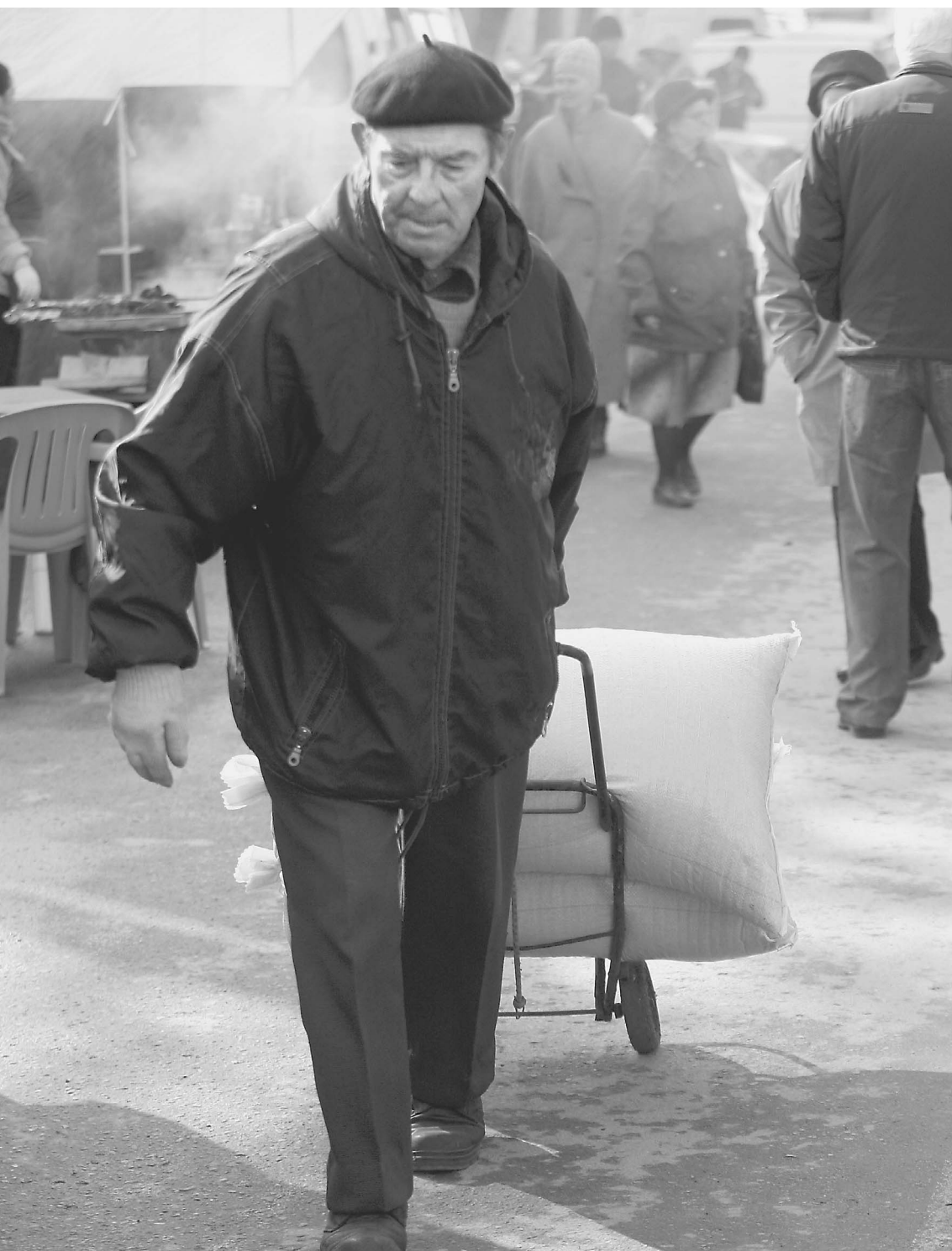
С приходом кризиса люди начали ПОКУПАТЬ САХАР МЕШКАМИ

«Известия» ищут виновных в резком росте цен на сахар