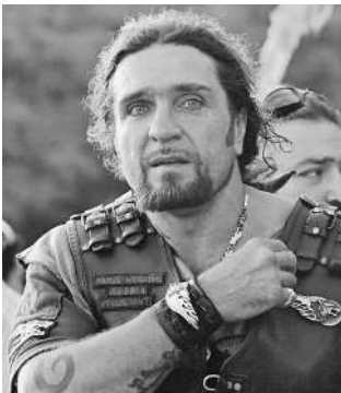
Александр Залдостанов приводит хозяйство «Ночных волков» в порядок