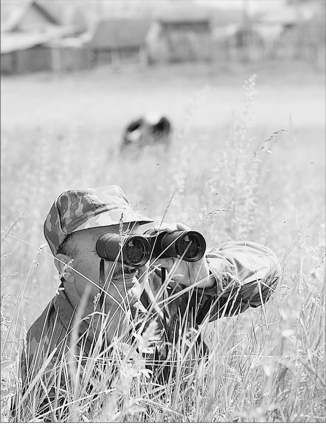
...а ты не воруй!