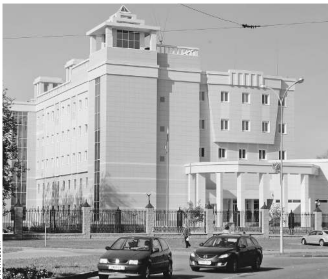
Посольство в Минске оказалось значительно масштабней проекта

Так, ФГУП «РИА Новости» и ФГУП «Информационное телеграфное агентство России» не используют 11 объектов общей площадью 3 тыс. кв. м, переданных этим медиакомпаниям на праве безвозмездного пользования. В этих объектах должны были размещаться зарубежные представительства «РИА Новости» и ИТАР-ТАСС. Счетная палата озабочена тем, что феде-