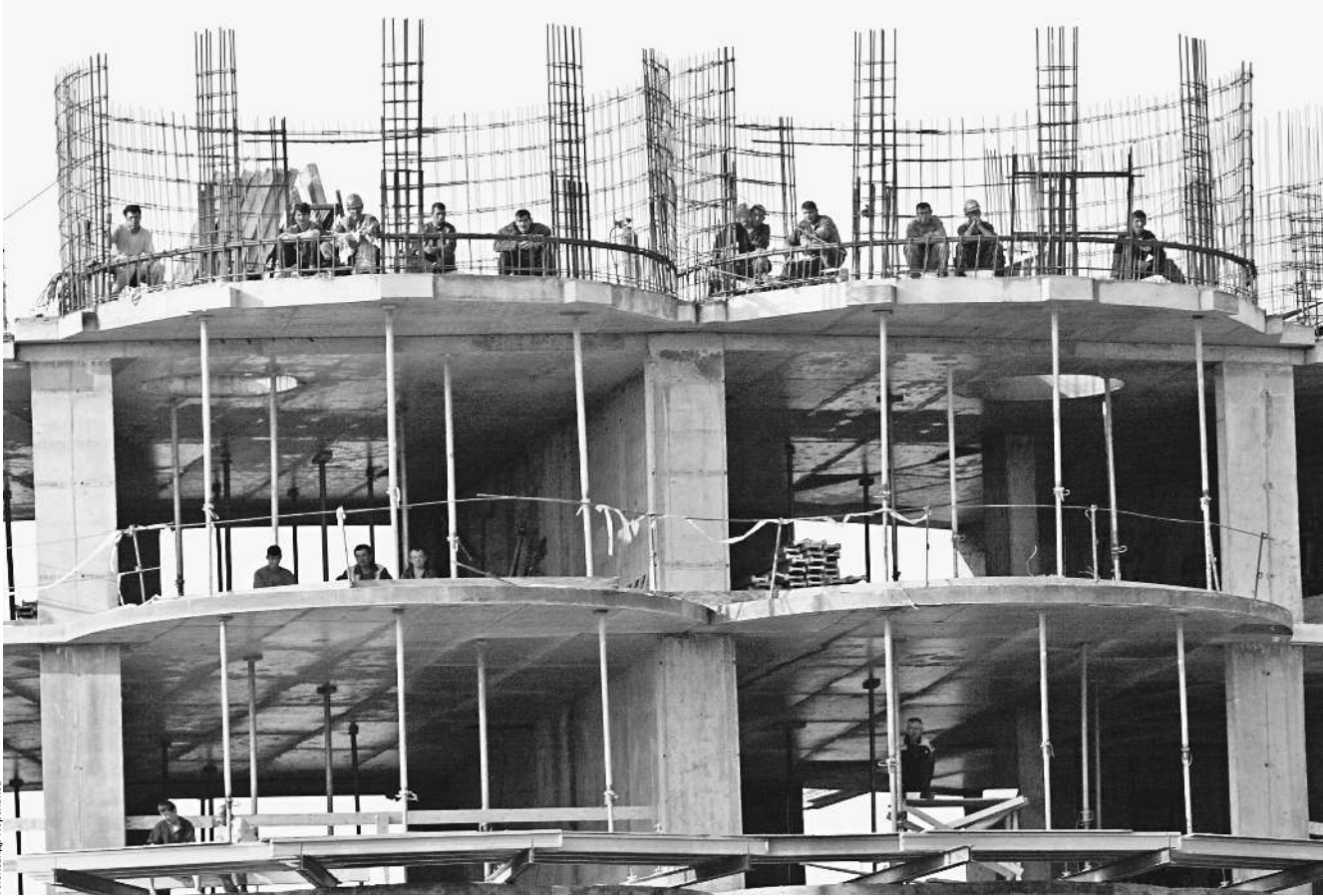
Трудовые подвиги мигрантов обходятся бюджету в несколько раз дороже