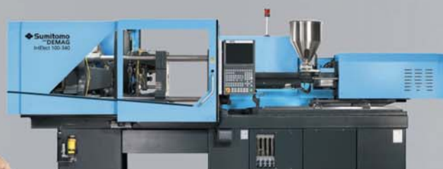
IntElect – прецизионная машина

Высочайшая точность с максимальной эффективностью