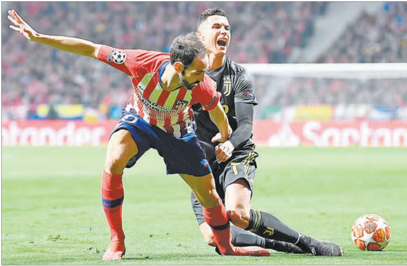
Вчера, Мадрид. «Атлетико» - «Ювентус» - 2:0. Защитники мадридцев не дали развернуться лидеру гостей КРИШТИАНУ РОНАЛДУ.

Взвора была игра с началом второго тайма, и Коста окончательно превратился в антигероев вечера. Проводивший 500-й матч на клубном уровне Бонуччи лишь сопровождал своего оппонента, но тот после чистого выхода один на один даже не попал в створ. А когда Гризманн перебрался голкипера, ворота гостей совместными усилиями отстояли Щенсны, перекладина и предотвративший добивание Кьеллини.